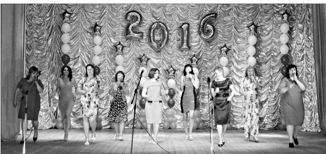
Музыкальный подарок от мам выпускников.

Всё, торжественная часть завершается, Лариса Геннадьевна ещё раз обращается к выпускникам, напоминая о том, что самая редкая профессия – хороший человек и искренне желает быть такими. Пусть силы небесные дарят вам вечность./ Пусть