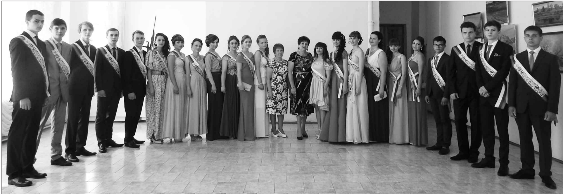
Выпускники 2016 года Ульяновской средней школы.